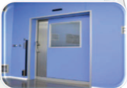
Pintu otomatis Kedap Udara

Selain sistem tata udara yang menjadi jantung kesterilan sebuah ruang operasi maka perlu didukung menggunakan material - material yang sesuai dengan ketentuan PERMENKES 40/2022 antara lain penggunaan panel dinding, plafon, lantai vinyl wajib tidak berpori, mudah dibersihkan, tahan bahan kimia, anti bakteri, tahan api dan khusus untuk bahan lantai vinyl juga wajib antistatik dan anti gesek, sedangkan pintu wajib dilengkapi sistem otomatis dan kelengkapan lain seperti medikal gas dan elektrical wajib disesuaikan pula dengan persyaratan PERMENKES 40/2022 dan kami melakukan hal tersebut agar ruang operasi yang kami bangun berfungsi dengan baik dan terjaga kesterilan nya.